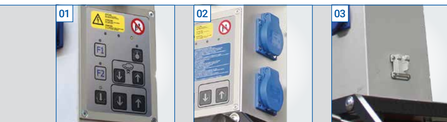
01 Integrierte Hebebühnensteuerung (Option)