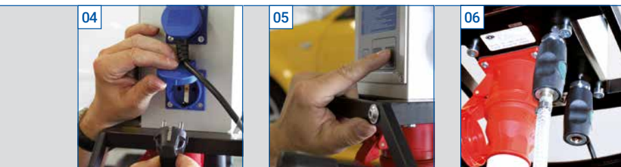
04 Idealer Abstand der Steckdosen für leichte Zugänglichkeit.