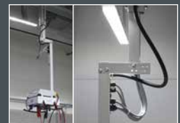
Die Spezialaufhängung mit integrierter Stromführung gewährleistet die gerade Montage der E-BOX.

erstem 5 m-Kabel und CE-Konformitätserklärung ausgeliefert